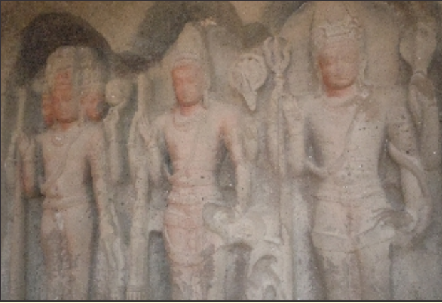
ಎಲ್ಲೋರಾದಲ್ಲಿ ಬ್ರಹ್ಮ-ವಿಷ್ಣು-ಮಹೇಶ್ವರರ ಅಪೂರ್ವ ಕೆತ್ತನೆ