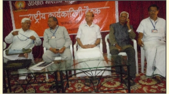
ರಾಷ್ಟ್ರೀಯ ಕಾರ್ಯಕಾರಿಣಿ ಸಭೆಯಲ್ಲಿ ಪದಾಧಿಕಾರಿಗಳು