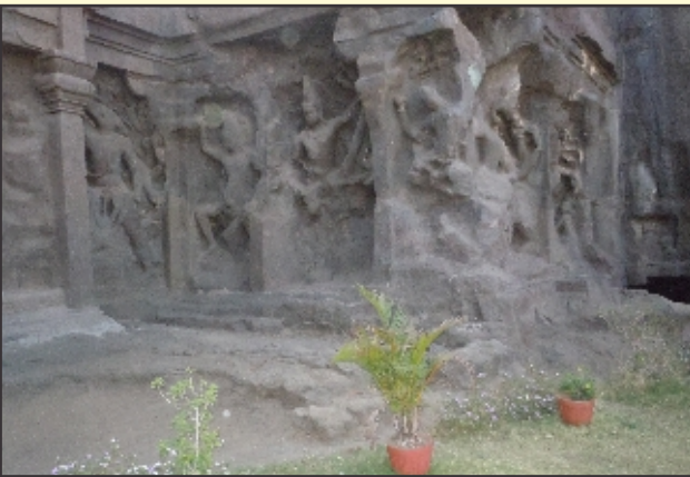
ಎಲ್ಲೋರಾದಲ್ಲಿ ಭಗ್ನಗೊಂಡಿರುವ ದಶಾವತಾರದ ಚಿತ್ರಗಳು