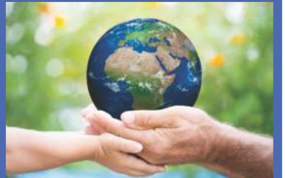
ವಿಶ್ವ ಭೂಮಿ ದಿನ

A Journal of Karnataka State Secondary Teachers' Association