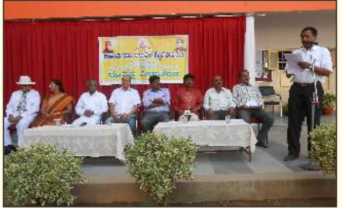
ಸಂಕಲ್ಪ ದಿನಾಚರಣೆ - ಬೆಂಗಳೂರು ಉತ್ತರ