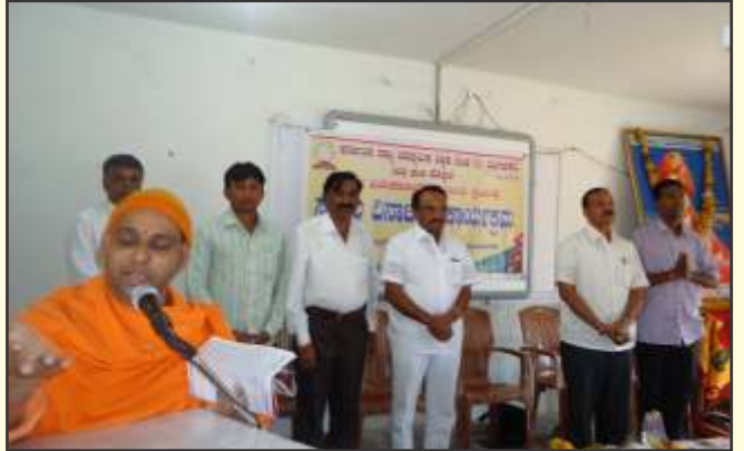
ಸಂಕಲ್ಪ ದಿನಾಚರಣೆ - ಕೊಪ್ಪಳ