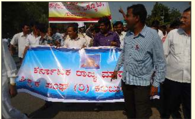
ಸಂಕಲ್ಪ ದಿನಾಚರಣೆ - ಕಲ್ಬುರ್ಗಿ

Registered No. RNI 45459/85 RNP/KA/BGS-125/2015-2017 Posted at Bangalore GPO Bangalore -560 001