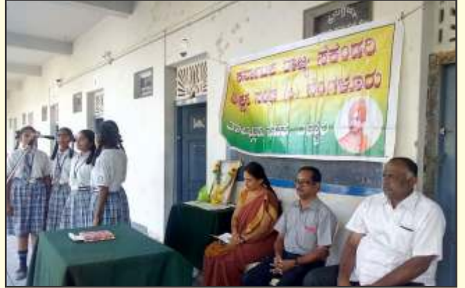
ಬಳ್ಳಾರಿ ಜಿಲ್ಲಾ ಘಟಕದಲ್ಲಿ ನಡೆದ ಸಂಕಲ್ಪ ದಿನಾಚರಣೆಯಲ್ಲಿ ಗಣ್ಯ ಅತಿಥಿಗಳು