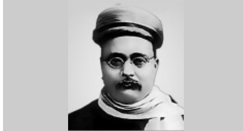
ಗೋಪಾಲಕೃಷ್ಣ ಗೋಖಲೆಯವರು (9.5.1866-19.5.1915)

ಗಣ್ಯ ರಾಜ್ಯಶಾಸ್ತ್ರಜ್ಞರೂ, ಅರ್ಥಶಾಸ್ತ್ರಜ್ಞರೂ, ಜನ ಸೇವಕರೂ, ಸಮಾಜಸುಧಾರಕರೂ, ಆದರ್ಶ ಅಧ್ಯಾಪಕರೂ, ಶ್ರೇಷ್ಠ ಶಿಕ್ಷಣ ತಜ್ಞರೂ ಮಾತ್ರವಲ್ಲ ಅಪ್ರತಿಮ ದೇಶಭಕ್ತರೂ ಆಗಿದ್ದರು. ಅವರು ಆಧುನಿಕ ಭಾರತದ ವಿಕಾಸಕ್ಕೆ ಅಸ್ತಿಭಾರ ನಿರ್ಮಿಸಿದ ಪ್ರಮುಖಲೋಖರು. ಡಿ.ವಿ ಗುಂಡಪ್ಪನವರೂ ಸೇರಿದಂತೆ ಹಿಂದಿನ ತಲೆಮಾರಿನ ಹತ್ತಾರು ಜನ ಸಮಾಜ ಸೇವಕರಿಗೆ ಪ್ರೇರಣಾ ಸ್ತೋತ್ರವಾಗಿದ್ದವರು. ಎಲ್ಲಕ್ಕೂ ಮಿಗಿಲಾಗಿ ಮಹಾತ್ಮ ಗಾಂಧಿಯವರ ರಾಜಕೀಯ ಗುರುಗಳಾಗಿದ್ದವರು. ಅವರ 150ನೇ ಜನ್ಮ ವರ್ಷಾಚರಣೆಯ ನಿಮಿತ್ತ ಈ ಲೇಖನ.