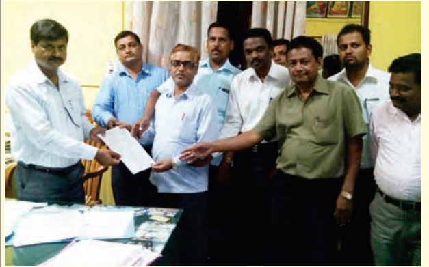
ಬೇಡಿಕೆಗಳ ಈಡೇರಿಕೆಗಾಗಿ ಕರ್ನಾಟಕ ರಾಜ್ಯ ಮಾಧ್ಯಮಿಕ ಶಿಕ್ಷಕ ಸಂಘದ ಪದಾಧಿಕಾರಿಗಳು ಮನವಿ ಸಲ್ಲಿಸುತ್ತಿರುವುದು.

ಸಮಾಜಕ್ಕೆ ಏನೂ ಕೊಡದೆ ಅದರಿಂದ ಪಡೆಯುತ್ತಾ ಹೋದರೆ ಅದು ದುರ್ಬಲವಾಗುತ್ತದೆ. ಆದ್ದರಿಂದ ಸಮಾಜಕ್ಕೆ ಸಲ್ಲಿಸಬೇಕಾದುದು ಪ್ರತೀ ವ್ಯಕ್ತಿಯ ಆದ್ಯ ಕರ್ತವ್ಯ.