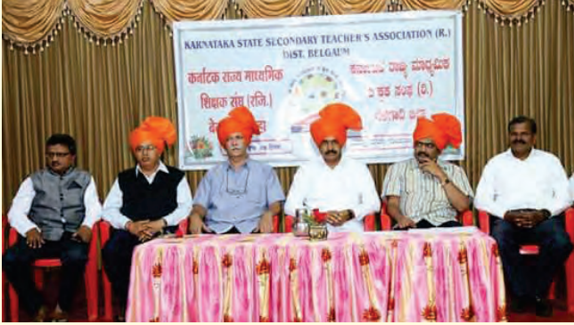
ಬೆಳಗಾಂ ಜಿಲ್ಲಾ ಘಟಕದ ರಚನೆಯ ಸಭೆಯಲ್ಲಿ ಗಣ್ಯರು.