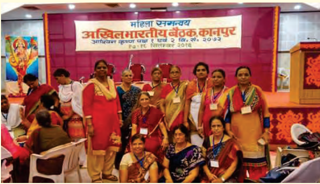
ಸೆಪ್ಟೆಂಬರ್ 17 ಮತ್ತು 18 ರಂದು ಖಾನ್‌ಪುರದಲ್ಲಿ ನಡೆದ ಅಖಿಲ ಭಾರತೀಯ ಮಹಿಳಾ ಸಮನ್ವಯ ಸಭೆಯಲ್ಲಿ ಕರ್ನಾಟಕದ ಪ್ರತಿನಿಧಿಗಳು