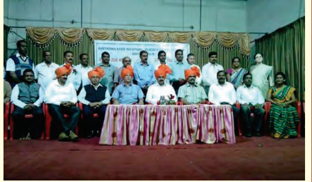
ಬೆಳಗಾಂ ಜಿಲ್ಲಾ ಘಟಕದ ನೂತನ ಪದಾಧಿಕಾರಿಗಳು