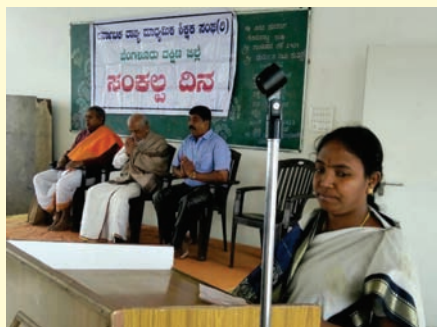
ಬೆಂಗಳೂರು ದಕ್ಷಿಣ ಜಿಲ್ಲಾ ಘಟಕದ ವತಿಯಿಂದ ಸಂಕಲ್ಪ ದಿನಾಚರಣೆ