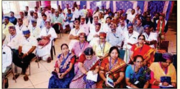
ಶಿವಮೊಗ್ಗ ಕಾರ್ಯಕಾರಿಣಿಯಲ್ಲಿ ಭಾಗವಹಿಸಿದ ವಿವಿಧ ರಾಜ್ಯಗಳ ಪ್ರತಿನಿಧಿಗಳು