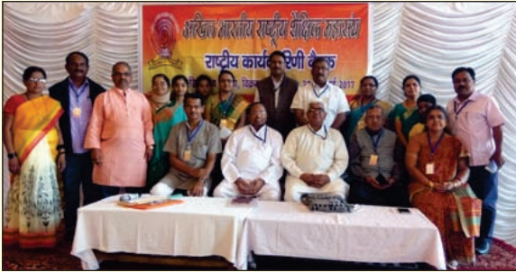
ರಾಷ್ಟ್ರೀಯ ಶೈಕ್ಷಣಿಕ ಮಹಾಸಂಘದ ಕಾರ್ಯಕಾರಿಣಿಯಲ್ಲಿ ಕರ್ನಾಟಕದ ತಂಡ.