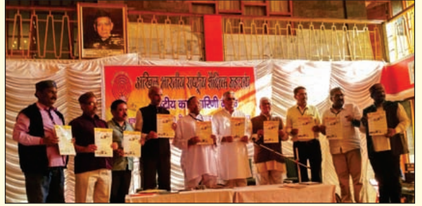
ಕಾರ್ಯಕಾರಿಣಿಯಲ್ಲಿ ಕರ್ನಾಟಕ ರಾಜ್ಯ ಮಹಾವಿದ್ಯಾಲಯ ಸಂಘವು ಹೊರತರುತ್ತಿರುವ ಹೊಸ ಪತ್ರಿಕೆಯ ಮೊದಲ ಸಂಚಿಕೆಯ ಉದ್ಘಾಟನೆ.