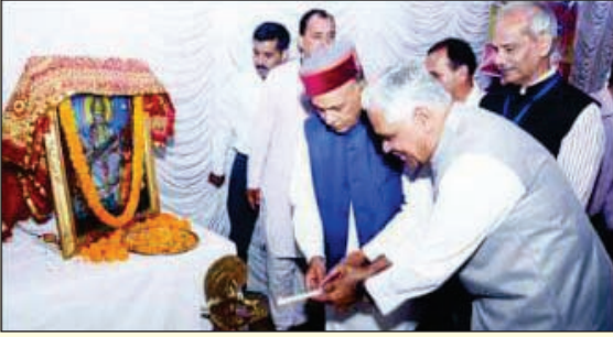
ದಿನಾಂಕ 27-5-17 ರಂದು ಶಿವಮೊಗ್ಗದಲ್ಲಿ ನಡೆದ ಕಾರ್ಯಕಾರಿಣಿಯನ್ನು ಹಿಮಾಚಲದ ಮಾಜಿ ಮುಖ್ಯಮಂತ್ರಿಗಳಾದ ಪ್ರೇಮ್‌ಕುಮಾರ್ ಧುಮಾಲ್‌ರವರು ಉದ್ಘಾಟಿಸುತ್ತಿರುವುದು.