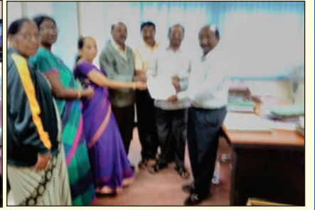
ಜಿಲ್ಲಾಧಿಕಾರಿಗಳ ಮೂಲಕ ಬೆಂಗಳೂರು ದಕ್ಷಿಣ ಮತ್ತು ಉತ್ತರ ಜಿಲ್ಲೆಗಳಿಂದ ಮನವಿ

ಗಮನಿಸಿ : ಕಾರ್ಯಕ್ರಮ ಮತ್ತು ಚಿತ್ರದ ವರದಿಗಳನ್ನು ಕಾರ್ಯಕ್ರಮ ನಡೆಸಿದ ತಕ್ಷಣವೇ ಕಳುಹಿಸಿ ಕೊಡಿ. ನಿಮ್ಮ ಯಾವುದೇ ಬರಹಗಳು, ವರದಿಗಳನ್ನು 'ನುಡಿ'ಯಲ್ಲಿ ಕಂಪೋಸಿಂಗ್ ಮಾಡಿ ಫೋಟೋ ಸಹಿತ akss1950@gmail.com ಇ-ಮೇಲ್‌ಗೆ ಕಳುಹಿಸಿಕೊಡಿ