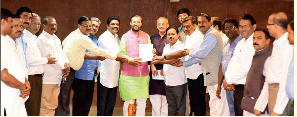
ಕ.ರಾ.ಮಾ.ಶಿ.ಸಂಘದ ಪದಾಧಿಕಾರಿಗಳು ಕೇಂದ್ರ ಸಚಿವರಿಗೆ ಮನವಿ ಸಲ್ಲಿಸುತ್ತಿರುವುದು