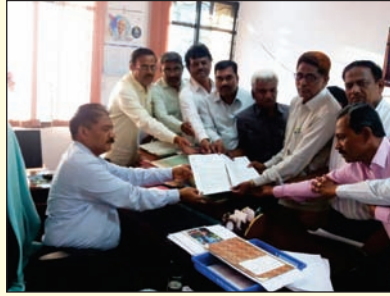
ಜಿಲ್ಲಾಧಿಕಾರಿಗಳ ಮೂಲಕ ಬೀದರ್ ಜಿಲ್ಲಾ ಘಟಕದ ಮನವಿ