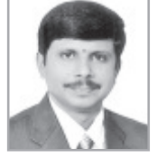
ವಿ. ರಾಜ ಶಿಕ್ಷಣ ಪ್ರಕೋಷ್ಠ ಪ್ರಮುಖ್ ಕರ್ನಾಟಕ ರಾಜ್ಯ ಮಾಧ್ಯಮಿಕ ಶಿಕ್ಷಕ ಸಂಘ

ಹುಟ್ಟಿದಾಗಿನಿಂದ ಮಗು ತನ್ನ ಸುತ್ತಲಿನ ಪ್ರಪಂಚವನ್ನು ಅರಿಯಲು ಪ್ರಮುಖವಾಗಿ ಅವಲಂಬಿಸೋದು ಅನುಕರಣಾ ವಿಧಾನವನ್ನು. ತನ್ನ ತಾಯ್ತಂದೆಯರನ್ನು, ಸುತ್ತಲಿನ ಸಮಾಜವನ್ನು ಅರ್ಥ ಮಾಡೊಳ್ಳೋಕೆ ಮುಖ್ಯ ಸಾಧನ ಭಾಷೆ. ಭಾಷಾ ವಿಜ್ಞಾನಿಗಳ ಅಧ್ಯಯನದಂತೆ ಪ್ರತಿ ಮಗುವೂ ತಾನು ಮೊದಲು ತೆರೆದು ಕೊಳ್ಳುವ ನುಡಿಯ ಸ್ವಭಾವ, ವ್ಯಾಕರಣ, ಬಳಕೆ ಮಾಡೋ ರೀತಿ, ಸೊಗಡನ್ನು ಮೊದಲ ಆರು ವರ್ಷಗಳಲ್ಲಿ ಅತಿ ಸಹಜವಾಗಿ ಕಲಿಯುತ್ತದೆ. ಇನ್ನೆಲ್ಲಾ ಭಾಷಾ ಕಲಿಕೆಯನ್ನೂ ಆ ಅಡಿಪಾಯದ ಅನುಭವದ ಮೇಲೆ ಕಲಿಯುತ್ತವೆ. ಬಾಲ್ಯದಲ್ಲಿ ತಾಯ್ನುಡಿಗೇ ತೆರೆದುಕೊಳ್ಳುವುದರಿಂದಾಗಿ ಪ್ರಪಂಚವನ್ನು ಅರಿಯಲು ಮನುಷ್ಯನಿಗೆ ಇರುವ ಅತ್ಯುತ್ತಮ ಸಾಧನವೆಂದರೆ ತಾಯ್ನುಡಿಯೇ ಆಗಿದೆ. ಹೀಗಾಗಿ ವಿಷಯವನ್ನು ಅರ್ಥ ಮಾಡಿಕೊಳ್ಳುವಿಕೆ, ಯೋಚಿಸುವಿಕೆ ಎಲ್ಲವೂ ಆ ಮೊದಲು ಕಲಿಯುವ ಭಾಷೆಯಲ್ಲಿರುವುದು ಸಹಜವಾಗುತ್ತದೆ. ಆ ಕಲಿಕೆ ಬರುವುದು ಹೇಳಿಕೊಡುವುದರಿಂದಲ್ಲ, ಗಮನಿಸುವುದರಿಂದ, ಸುತ್ತಲಿನ ಪರಿಸರದಿಂದ. ಹಾಗಾಗಿ ಕನ್ನಡಿಗರ ಕಲಿಕೆ ಕನ್ನಡದಿಂದಲೇ ಅತ್ಯುತ್ತಮವಾಗಲು ಸಾಧ್ಯ. ಕಲಿಕೆ ಅತ್ಯುತ್ತಮವಾಗುವುದು ಎನ್ನುವುದರ ಅರ್ಥ ಕಲಿಯುವ ವಿಷಯದ ಬಗ್ಗೆ ಆಳವಾದ ಅರಿವು, ವಿಷಯ ಅರ್ಥವಾಗುವುದು. ಮಕ್ಕಳು ಶಾಲೆ ಸೇರುವ ಹೊತ್ತಿಗಾಗಲೇ ಈ ತಾಯ್ನುಡಿಯ ಅಡಿಪಾಯ ಬಿದ್ದಿರುವುದರಿಂದ ಶಾಲಾ ಕಲಿಕೆ ತಾಯ್ನುಡಿಯಲ್ಲಿರುವುದು ಸರಿಯಾದದ್ದು ಎನ್ನುವುದು ಭಾಷಾ ವಿಜ್ಞಾನಿಗಳ ಅನಿಸಿಕೆ.