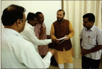
ಗುಲ್ಬರ್ಗ ಜಿಲ್ಲಾ ಘಟಕದಿಂದ ಕೇಂದ್ರ ಸಚಿವರಿಗೆ ಮನವಿ