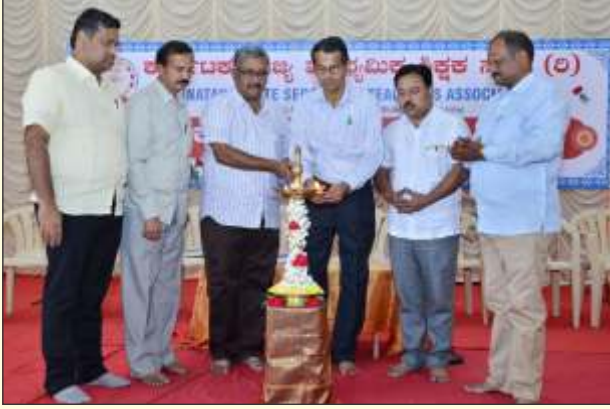
ಹುಬ್ಬಳ್ಳಿಯ ಕಾರ್ಯಕಾರಿಣಿಯಲ್ಲಿ ಪದಾಧಿಕಾರಿಗಳು ದೀಪ ಬೆಳಗುತ್ತಿರುವುದು