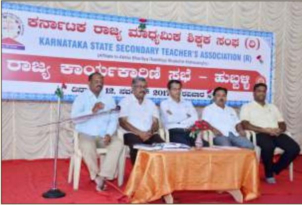
ಹುಬ್ಬಳ್ಳಿಯ ಕಾರ್ಯಕಾರಿಣಿ ಸಭೆಯಲ್ಲಿ ಉಪಸ್ಥಿತರಿದ್ದ ಪದಾಧಿಕಾರಿಗಳು