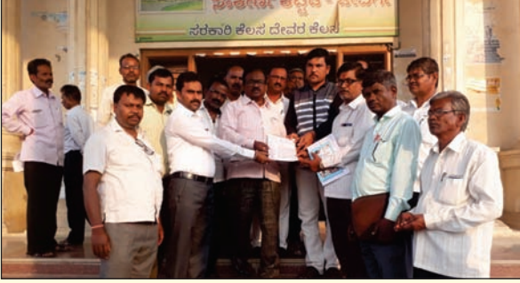
ಜೀವರ್ಗ ತಾಲೂಕು ಘಟಕದ ವತಿಯಿಂದ ಜಿಲ್ಲಾಧ್ಯಕ್ಷರಿಗೆ ಮನವಿ