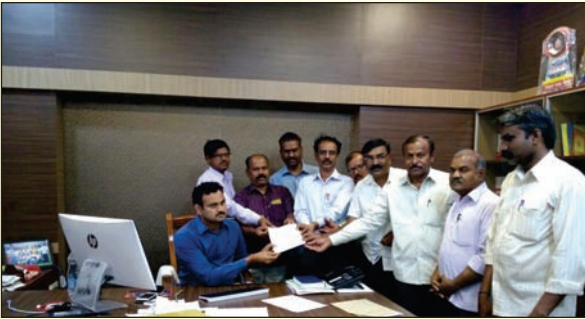
ಕೊಪ್ಪಳ ಜಿಲ್ಲಾ ಘಟಕದ ವತಿಯಿಂದ ಜಿಲ್ಲಾಧ್ಯಕ್ಷರಿಗೆ ಮನವಿ