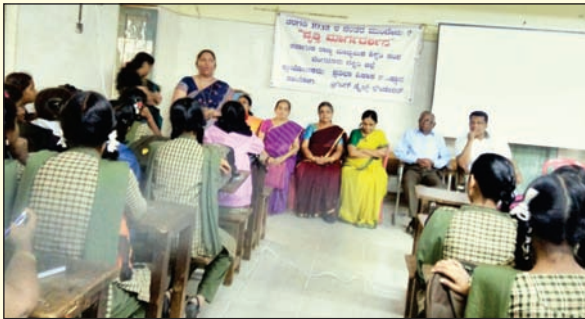
ಹತ್ತನೇ ತರಗತಿ ಹಾಗೂ ದ್ವಿತೀಯ ಪಿ.ಯು.ಸಿ ವಿದ್ಯಾರ್ಥಿಗಳಿಗೆ 'ವೃತ್ತಿ ಮಾರ್ಗದರ್ಶನ' ಕಾರ್ಯಕ್ರಮ