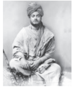
- ಸ್ವಾಮಿ ವಿವೇಕಾನಂದ

66 ಶಿಕ್ಷಣವೆಂದರೆ ನಿಮ್ಮ ಮಿದುಳಿನ ಒಳಗೆ ತುರುಕಿಸಿದ ಮತ್ತು ನಿಮ್ಮೊಳಗೆ ನಿಮ್ಮ ಬದುಕಿನುದ್ದಕ್ಕೂ ಪಟನಗೊಳ್ಳದೇ ಹರಿದಾಡುವ ಸರಕು ಅಲ್ಲ. ಬದುಕನ್ನು ಕಟ್ಟುವ ಮನುಷ್ಯನನ್ನು ನಿರ್ಮಿಸುವ ಕಲ್ಪನೆಗಳನ್ನು ಕರಗತಮಾಡಿಕೊಂಡು ಜಾಲಿತ್ಯವನ್ನು ಉದ್ದೀಪನಗೊಳಿಸುವ ಶಿಕ್ಷಣ ಬೇಕು. ನೀವು ಐದು ಕಲ್ಪನೆಗಳನ್ನು ಕರಗತ ಮಾಡಿಕೊಂಡು ಆ ಮೂಲಕ ನಿಮ್ಮ ಬದುಕನ್ನೂ ಜಾಲಿತ್ಯವನ್ನೂ ರೂಪಿಸಿಕೊಂಡಿದ್ದಲ್ಲಿ ಇಡೀ ಗ್ರಂಥಾಲಯವನ್ನೇ ಬಾಂಬುಪಾಠ ಮಾಡಿದ ಮನುಷ್ಯನಿಂತ ನಿಮಗೆ ಹೆಚ್ಚಿನ ಶಿಕ್ಷಣ ಸಿಕ್ಕಿದೆ ಎಂದು ಭಾವಿಸಬೇಕು. ನಮಗೆ ಎಂತಹ ಶಿಕ್ಷಣ ಬೇಕು ಅಂದರೆ ಅದರಿಂದ ಜಾಲಿತ್ಯ ನಿರ್ಮಾಣವಾಗಬೇಕು. ಮನಸ್ಸಿನ ಶಕ್ತಿ ವೃದ್ಧಿಯಾಗಬೇಕು. ಜ್ಞಾನ ವಿಕಸಿಸಬೇಕು ಮತ್ತು ಆ ಮೂಲಕ ಆತ ತನ್ನ ಕಾಲುಗಳ ಮೇಲೆ ನಿಲ್ಲುವಂತಾಗಬೇಕು.