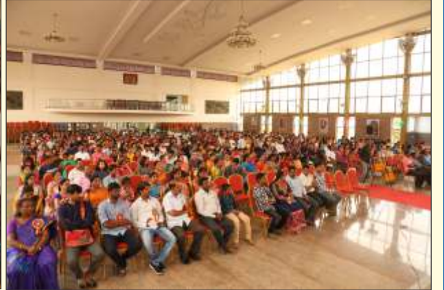
ಪ್ರತಿಭಾ ಪುರಸ್ಕಾರ ಕಾರ್ಯಕ್ರಮದಲ್ಲಿ ವಿದ್ಯಾರ್ಥಿಗಳು ಹಾಗೂ ಪೋಷಕರು

ಶಿಕ್ಷಕ ಸಮಾಚಾರಕ್ಕೆ ಕಾರ್ಯಕ್ರಮ ಮತ್ತು ಚಿತ್ರದ ವರದಿಗಳನ್ನು ಕಾರ್ಯಕ್ರಮ ನಡೆಸಿದ ತಕ್ಷಣವೇ ಕಳುಹಿಸಿ ಕೊಡಿ. ನಿಮ್ಮ ಯಾವುದೇ ಬರಹಗಳು, ವರದಿಗಳನ್ನು 'ನುಡಿ'ಯಲ್ಲಿ ಕಂಪೋಸಿಂಗ್ ಮಾಡಿ ಫೋಟೋ ಸಹಿತ ಪ್ರತಿ ತಿಂಗಳು 5 ನೇ ತಾರೀಖಿನೊಳಗೆ akss1950@gmail.com ಇ-ಮೇಲ್ ಗೆ ಕಳುಹಿಸಿಕೊಡಿ.