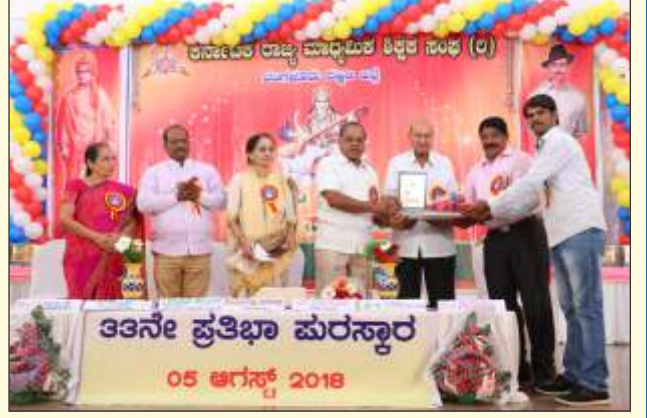
ಬೆಂಗಳೂರು ದಕ್ಷಿಣ ಜಿಲ್ಲೆಯ 33ನೇ ವರ್ಷದ ಪ್ರತಿಭಾ ಪುರಸ್ಕಾರ ಕಾರ್ಯಕ್ರಮದಲ್ಲಿ ಗಣ್ಯರು