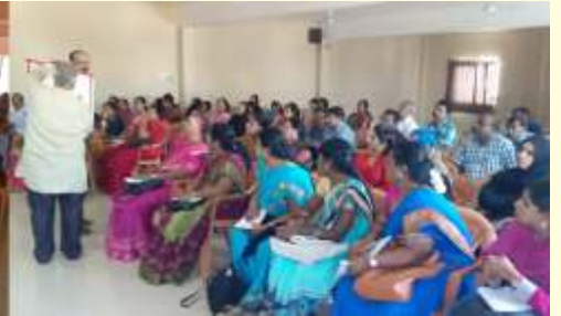
ರಾಜ್ಯಮಟ್ಟದ ಸಂಸ್ಕೃತ ಶಿಕ್ಷಕರ ಸಮಾವೇಶ