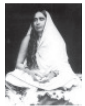
- ಶ್ರೀಮಾತೆ ಶಾರದಾದೇವಿ

ಮನಸ್ಸು ಏಕಾಗ್ರವಾಗಿದ್ದರೂ ಪವಿತ್ರ ನಾಮ ಜಪವನ್ನು ಮಾತ್ರ ಬಿಡಬೇಡ. ನಿನ್ನ ಕರ್ತವ್ಯವನ್ನು ನೀನು ಮಾಡು. ನಾಮ ಜಪ ಮಾಡುವಾಗ ಮನಸ್ಸು ಗಾಳಿಯಿಲ್ಲದ ಪ್ರದೇಶದಲ್ಲಿಟ್ಟ ದೀಪದಂತೆ ಅಲುಗಾಡದೆ ಸ್ಥಿರವಾಗಿರುವುದು. ದೀಪ ಅಲುಗಾಡುವಂತೆ ಮಾಡುವುದು ಗಾಳಿ. ಅದೇ ರೀತಿ ನಮ್ಮ ಬಯಕೆ, ವಾಸನೆಗಳು ಮನಸ್ಸನ್ನು ಚಂಚಲಗೊಳಿಸುವುವು.