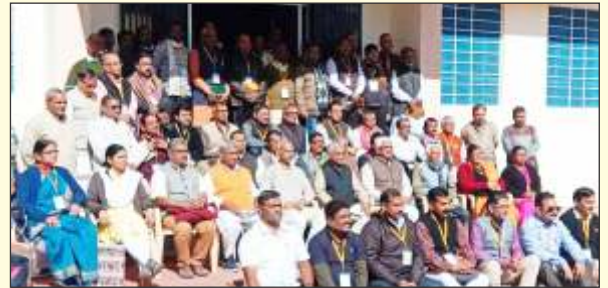
ರಾಜಸ್ಥಾನದ ಉದಯಪುರದಲ್ಲಿ ನಡೆದ ವಿಚಾರವರ್ಗದಲ್ಲಿ ಕರ್ನಾಟಕದ ಪ್ರತಿನಿಧಿಗಳು

ಶಿಕ್ಷಕ ಸಮಾಚಾರಕ್ಕೆ ಕಾರ್ಯಕ್ರಮ ಮತ್ತು ಚಿತ್ರದ ವರದಿಗಳನ್ನು ಕಾರ್ಯಕ್ರಮ ನಡೆಸಿದ ತಕ್ಷಣವೇ ಕಳುಹಿಸಿ ಕೊಡಿ. ನಿಮ್ಮ ಯಾವುದೇ ಬರಹಗಳು, ವರದಿಗಳನ್ನು 'ನುಡಿ'ಯಲ್ಲಿ ಕಂಪೋಸಿಂಗ್ ಮಾಡಿ ಫೋಟೋ ಸಹಿತ ಪ್ರತಿ ತಿಂಗಳು 5 ನೇ ತಾರೀಖಿನೊಳಗೆ akss1950@gmail.com ಇ-ಮೇಲ್‌ಗೆ ಕಳುಹಿಸಿಕೊಡಿ.