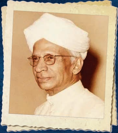
ಡಾ|| ಎಸ್. ರಾಧಾಕೃಷ್ಣನ್