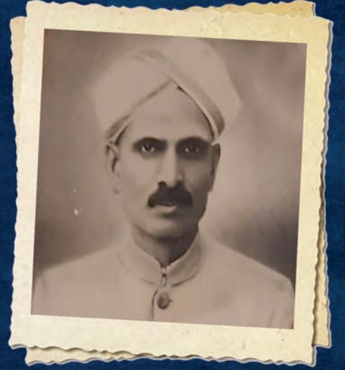
ಪ್ರೊ. ಟಿ. ಎಸ್. ವೆಂಕಣ್ಣಯ್ಯ