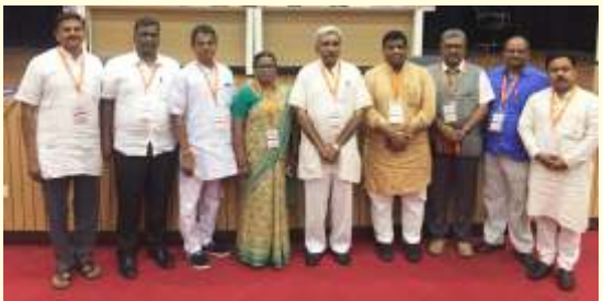
ಅಖಿಲ ಭಾರತೀಯ ರಾಷ್ಟ್ರೀಯ ಶೈಕ್ಷಣಿಕ ಮಹಾಸಂಘದ ರಾಷ್ಟ್ರೀಯ ಕಾರ್ಯಕಾರಿಣಿ