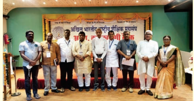
ಗುಜರಾತ್‌ನಲ್ಲಿ ನಡೆದ ಅ.ಭಾ.ರಾ.ಶೈ. ಮಹಾಸಂಘದ ಅಖಿಲ ಭಾರತೀಯ ಕಾರ್ಯಕಾರಿಣಿ ಸಭೆಯಲ್ಲಿ ಕರ್ನಾಟಕದ ಪ್ರತಿನಿಧಿಗಳು