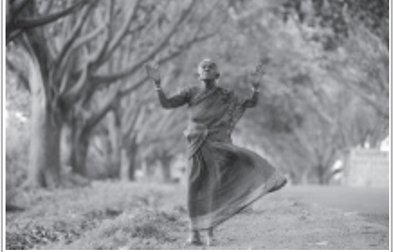
ಆತ್ಮವಿಶ್ವಾಸ ಮತ್ತು ಕ್ರಿಯಾಶೀಲತೆಯ ಪ್ರತಿರೂಪ : ಮಹಿಳೆ

ಹಾಗಾದರೆ ಇದಕ್ಕೆ ಪರಿಹಾರವೇನು? ಹೆಣ್ಣು ತನ್ನನ್ನು ತಾನೇ ರಕ್ಷಿಸಿಕೊಳ್ಳುವ ಎಲ್ಲ ಬಗೆಯ ಸಾಮರ್ಥ್ಯವನ್ನು ಹೊಂದಬೇಕು. ಅದಕ್ಕೆ ಅಗತ್ಯವಾದ ಶಿಕ್ಷಣವನ್ನು, ದೈಹಿಕ, ಮಾನಸಿಕ ದೃಢತೆಯನ್ನು ಚಿಕ್ಕಂದಿನಿಂದಲೇ ಆಕೆಗೆ ಒದಗಿಸಬೇಕು. ತನ್ನಲ್ಲಿನ ಪ್ರತಿಭೆಯನ್ನು ಅಳಿಸಿ, ಕಾರ್ಯಕ್ಷಮತೆಯನ್ನಾಗಲೀ ಸಮಾಜದ ಮುಂದೆ ಅನಾವರಣ ಮಾಡುವ ಅವಕಾಶ ಅವಳಿಗೆ ಸಿಕ್ಕಬೇಕು. ಹೆಣ್ಣು ಎಂಬ ಒಂದೇ ಕಾರಣಕ್ಕೆ ಆಕೆಯು ಅದಷ್ಟೇ ಸಮರ್ಥ ಅಧಿಕಾರಿಯಾಗಿದ್ದರೂ ಆಕೆಯ ಅಧೀನದಲ್ಲಿ ಕೆಲಸ ಮಾಡಲು ಹಿಂಜರಿಯುತ್ತ, ಅಸಮಾಧಾನದಿಂದಲೇ ಕಾರ್ಯನಿರ್ವಹಿಸುವ ಪುರುಷರ ಸಂಖ್ಯೆಯೂ ಕಡಿಮೆಯಿಲ್ಲ. ಇವೆಲ್ಲ ಇಲ್ಲವಾಗಬೇಕು, ಅರ್ಹತೆಗೆ, ದಕ್ಷತೆಗೆ ಲಿಂಗ ತಾರತಮ್ಯವೇಕಿಲ್ಲ. ಸ್ವಾವಲಂಬಿಗಳಾಗಿ ಸಮಾಜದ ಗಟ್ಟಿಸ್ತಂಭಗಳಲ್ಲಿ ತಾವೂ ನಿಲ್ಲುತ್ತ ತಮ್ಮ ವ್ಯಕ್ತಿತ್ವದ ದೃಢತೆಯನ್ನು ನಿರೂಪಿಸುತ್ತಿರುವ ಅದಷ್ಟೋ ಹೆಣ್ಣು ಮಕ್ಕಳು ಇಂದು ದೇಶದ ಮೂಲೆ ಮೂಲೆಗಳಿಂದಲೂ ಮುಂದೆ ಬರುತ್ತಿದ್ದಾರೆ. ಇಂತಹ ಉದಾಹರಣೆಗಳಿಂದ ಹೆಮ್ಮೆಪಡಬೇಕು. ಆಗಬೇಕಿರುವ ಇನ್ನಷ್ಟು ಸಾಧನೆಗಳು ಕಾರ್ಯಗತವಾಗುವತ್ತ ಚಿಂತನೆ ಮಾಡುತ್ತ, ಕಾರ್ಯರೂಪಕ್ಕೂ ಇಳಿಸುತ್ತಾ ಸಮಾಜದ ಅಡ್ಡದಾರಿಗಳನ್ನು ಮುಚ್ಚುವಲ್ಲಿ ಸೂಕ್ತಕರ್ಮಗಳನ್ನು ಕೈಗೊಳ್ಳುವತ್ತ ದಿಟ್ಟ ನಿರ್ಧಾರಗಳನ್ನು ತೆಗೆದುಕೊಳ್ಳುವ ಕಾರ್ಯ ಆಗಬೇಕು. ಇದರಲ್ಲಿ ಸಮಾಜ, ಸರ್ಕಾರ ಎರಡೂ ಸಹಭಾಗಿಗಳಾಗಬೇಕು. ಮುಖ್ಯವಾಗಿ ಮಹಿಳೆ ತನ್ನ ಆತ್ಮಗೌರವಕ್ಕೆ ಕುಂದುಂಟಾಗುವ ಸಂದರ್ಭದಲ್ಲಿ ಅದನ್ನು ರಕ್ಷಿಸಿಕೊಳ್ಳುವ ದಿಟ್ಟತನವನ್ನು ಹೊಂದಬೇಕು. ಅದಕ್ಕೆ ಬೇಕಾದ ಸಾಮರ್ಥ್ಯವನ್ನು ಪಡೆದು ಆತ್ಮವಿಶ್ವಾಸದ ಸಾಕಾರಮೂರ್ತಿಯೆನಿಸಿಕೊಳ್ಳಬೇಕು. ಇದ್ದೆಲ್ಲ ಮಹಿಳಾದಿನದ ಸಂಕಲ್ಪವಾಗಿ, ಅನುಷ್ಠಾನಗೊಳಿಸುವ ಯಾತ್ರೆ ಪ್ರಾರಂಭಿಸಬೇಕು.