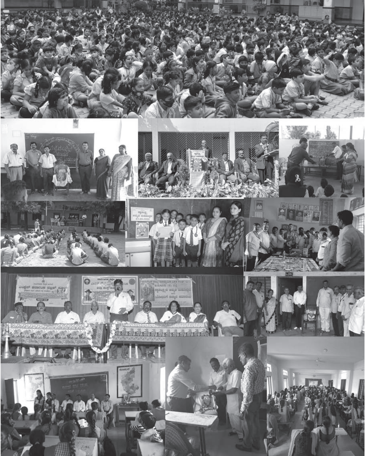
ಗುರುವಿನ ಕೆಲಸ ಸಹಜಪ್ರೇಮದಿಂದ ಕೂಡಿದ್ದಾಗಿರಬೇಕು - ಸ್ವಾಮಿ ವಿವೇಕಾನಂದ