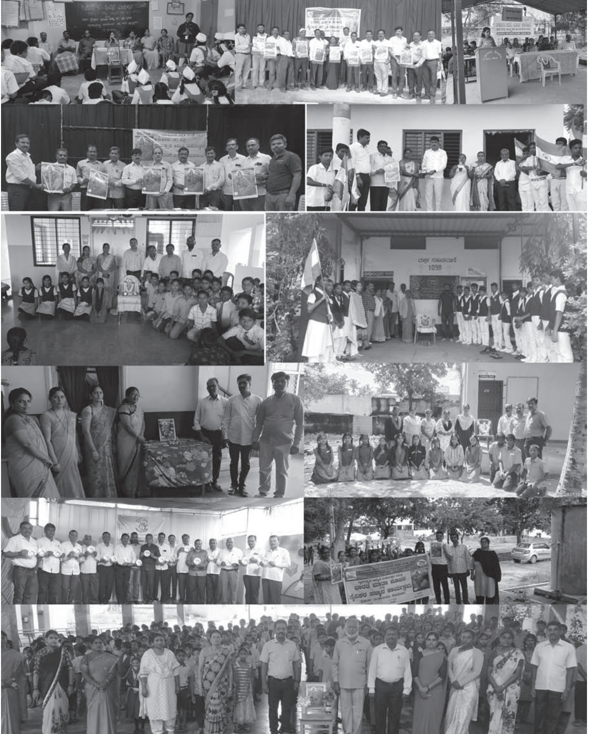
ಗುರು ಅತ್ಯಂತ ಪರಿಶುದ್ಧನಾಗಿರಬೇಕು -ಸ್ವಾಮಿವಿವೇಕಾನಂದ