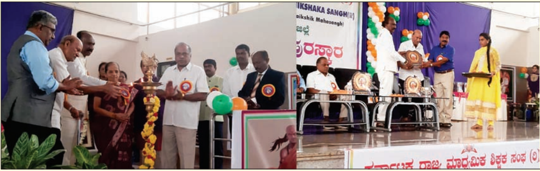
ಕರ್ನಾಟಕ ರಾಜ್ಯ ಮಾಧ್ಯಮಿಕ ಶಿಕ್ಷಕ ಸಂಘ - ಬೆಂಗಳೂರು ದಕ್ಷಿಣ ಜಿಲ್ಲೆಯ ಪ್ರತಿಭಾ ಪುರಸ್ಕಾರ ಕಾರ್ಯಕ್ರಮ