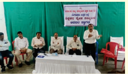
ಬೆಂಗಳೂರು ಉತ್ತರ ಜಿಲ್ಲೆಯ ವತಿಯಿಂದ ನಡೆದ ಶಿಕ್ಷಕ ಸ್ನೇಹ ಸಮ್ಮಿಲನ ಕಾರ್ಯಕ್ರಮ