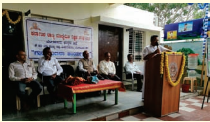
ಬೆಂಗಳೂರು ಉತ್ತರ ಜಿಲ್ಲೆಯ ವತಿಯಿಂದ ನಡೆದ ಗುರುವಂದನಾ ಕಾರ್ಯಕ್ರಮ