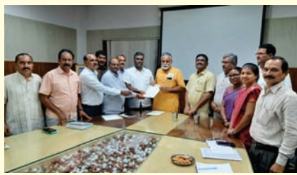
ಪ್ರಾಥಮಿಕ ಮತ್ತು ಪ್ರೌಢ ಶಿಕ್ಷಣ ಸಚಿವರಾದ ಮಾನ್ಯ ಶ್ರೀ ಬಿ.ಸಿ. ನಾಗೇಶ್ ಅವರೊಂದಿಗೆ ಶಿಕ್ಷಕ ಸಂಘದ ಪ್ರಮುಖರಿಂದ ಚರ್ಚೆ

ಎರಡು ದಿನ ನಡೆದ ರಾಷ್ಟ್ರೀಯ ಕಾರ್ಯಕಾರಿಣಿಯಲ್ಲಿ 21 ರಾಜ್ಯಗಳಿಂದ ಒಟ್ಟು 98 ಪ್ರಮುಖರು ಭಾಗವಹಿಸಿದ್ದರು.