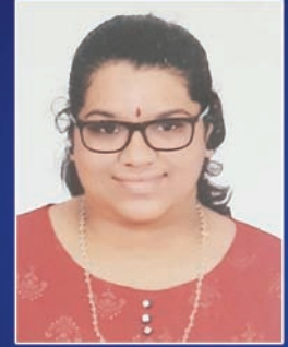
ನಿತನ್. ಎ.ಜಿ. ವಿಜ್ಞಾನ ವಿಭಾಗ 95%