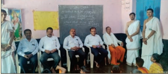
ವಸಂತ ವೇದ ಶಿಬಿರದಲ್ಲಿ ಪಾಲ್ಗೊಂಡ ಬೆಂಗಳೂರು ನಗರ ಜಿಲ್ಲೆಯ ಮಾಧ್ಯಮಿಕ ಶಿಕ್ಷಕ ಸಂಘದ ಪ್ರಮುಖ ಕಾರ್ಯಕರ್ತರು ಮತ್ತು ಶಿಬಿರದಲ್ಲಿ ಪಾಲ್ಗೊಂಡ ಶಿಬಿರಾರ್ಥಿಗಳು.

2022-23 ರ ದ್ವಿತೀಯ ಪಿಯುಸಿ ಪರೀಕ್ಷೆಯಲ್ಲಿ ಅತ್ಯಮೂಲ್ಯ ಅಂಕ ಗಳಿಸಿ ಉತ್ತೀರ್ಣರಾಗಿರುವ ಈ ಕೆಳಕಂಡ ವಿದ್ಯಾರ್ಥಿಗಳಿಗೆ ಕರ್ನಾಟಕ ರಾಜ್ಯ ಮಾಧ್ಯಮಿಕ ಶಿಕ್ಷಕ ಸಂಘದ