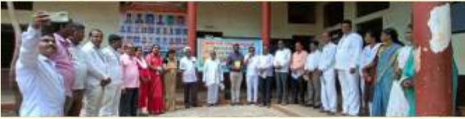
ಕರ್ನಾಟಕ ರಾಜ್ಯ ಮಾಧ್ಯಮಿಕ ಶಿಕ್ಷಕ ಸಂಘ (೦) ವತಿಯಿಂದ ಬೆಂಗಳೂರು ಉತ್ತರ ಜಿಲ್ಲೆ, ಬಳ್ಳಾರಿ, ಚಿಕ್ಕಬಳ್ಳಾಪುರ, ಬೀದರ್‌ನಲ್ಲಿ ನಡೆದ ಸದಸ್ಯತ್ವ ಅಭಿಯಾನ