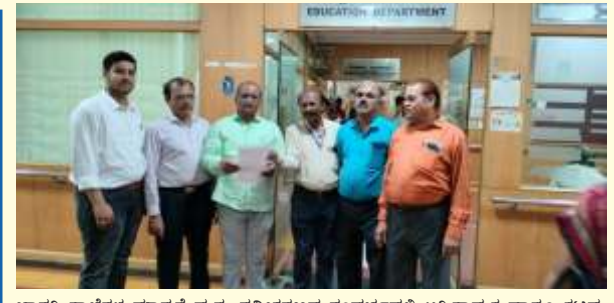
ಬಾಸಗಿ ಶಾಲೆಗಳ ಮಾನ್ಯತೆ ಮತ್ತು ನವೀಕರಣದ ಸಂದರ್ಭದಲ್ಲಿ ಅಗ್ನಿಶಾಮಕ ಹಾಗೂ ಕಟ್ಟಡ ಸುರಕ್ಷತಾ ಸಂಬಂಧ ಉಂಟಾಗಿರುವ ಸಮಸ್ಯೆಯನ್ನು ಮಾನ್ಯ ಪ್ರಧಾನ ಕಾರ್ಯದರ್ಶಿಗಳು ಶಿಕ್ಷಣ ಮತ್ತು ಸಾಕ್ಷರತಾ ಇಲಾಖೆ ಹಾಗೂ ಮಾನ್ಯ ಆಯುಕ್ತರಿಗೆ ಮಾಧ್ಯಮಿಕ ಶಿಕ್ಷಕ ಸಂಘದ ನಿಯೋಗ ಮನವರಿಕೆ ಮಾಡಿ, ಸಮಸ್ಯೆಯನ್ನು ಪರಿಹರಿಸಲು ಮನವಿ ಸಲ್ಲಿಸಲಾಯಿತು.