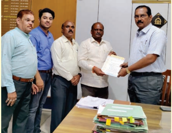
ಎಸ್‌ಎಸ್‌ಎಲ್‌ಸಿ ಪರೀಕ್ಷಾ ಕಾರ್ಯದಿಂದ ಪೌಢಶಾಲಾ ಶಿಕ್ಷಕರನ್ನು ವಿಮುಕ್ತಗೊಳಿಸದಿರಲು ಎಸ್‌ಎಸ್‌ಎಲ್‌ಸಿ ನಿರ್ದೇಶಕರಿಗೆ ಮನವಿ