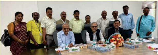
ಒಂದು ದೇಶ-ಒಂದೇ ವೇತನ ಕುರಿತು 7ನೇ ವೇತನ ಆಯೋಗಕ್ಕೆ ಮನವಿ