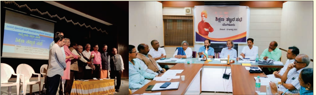
ಬೆಂಗಳೂರಿನಲ್ಲಿ ನಡೆದ ಶಿಕ್ಷಣ ತಜ್ಞರ ಸಭೆ