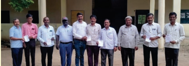
ಯಾದಗಿರಿಯಲ್ಲಿ ನಡೆದ ಸದಸ್ಯತಾ ಅಭಿಯಾನ