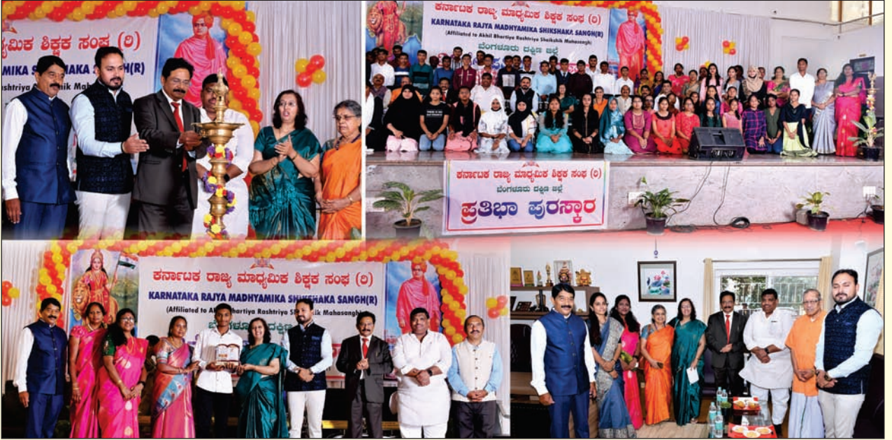
ಕರ್ನಾಟಕ ರಾಜ್ಯ ಮಾಧ್ಯಮಿಕ ಶಿಕ್ಷಕ ಸಂಘ (೦) ಬೆಂಗಳೂರು ದಕ್ಷಿಣ ಜಿಲ್ಲೆಯ ಪ್ರತಿಭಾ ಪುರಸ್ಕಾರ ಕಾರ್ಯಕ್ರಮ